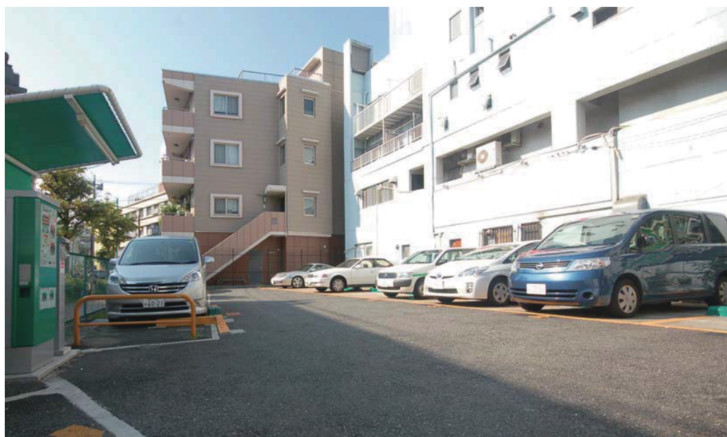
ショウワパーク若葉町