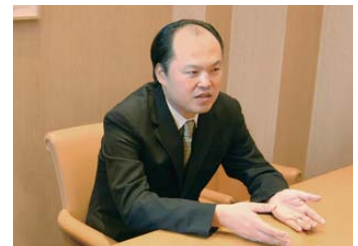
株式会社東京ビッグサイト