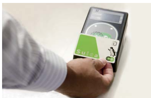
電子マネーでお支払い