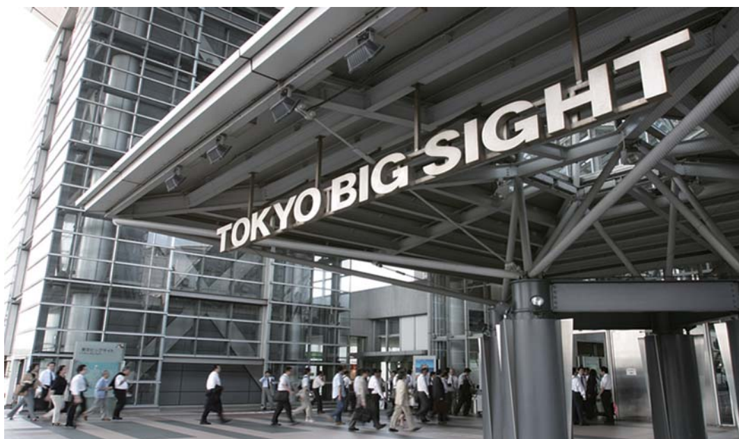
東京国際展示場 会議棟2F エントランス